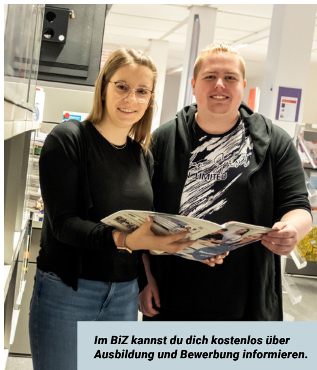
Im BiZ kannst du dich kostenlos über Ausbildung und Bewerbung informieren.

Jedes BiZ bietet unterschiedliche Veranstaltungen an. Wenn du auf der Seite deines BiZ unter Unser Veranstaltungsprogramm auf Veranstaltungen finden klickst, siehst du alle Termine. Sie finden im BiZ oder online per Video-Chat statt. Beispielsweise stellen sich Arbeitgeberinnen und Arbeitgeber vor oder du erhältst in Workshops Praxistipps zur Bewerbung und übst Vorstellungsgespräche.