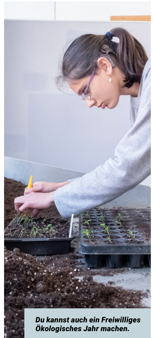
Du kannst auch ein Freiwilliges Ökologisches Jahr machen.