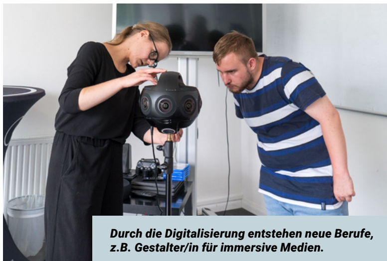
Durch die Digitalisierung entstehen neue Berufe, z.B. Gestalter/in für immersive Medien.

Die Ausbildung macht dich fit für die digitale Arbeitswelt. Deshalb lernst du in deiner Ausbildung zum Beispiel den richtigen Umgang mit Daten und digitalen Medien sowie das Recherchieren im Internet. Dabei werden die theoretischen und praktischen Inhalte deiner Ausbildung stets weiterentwickelt.